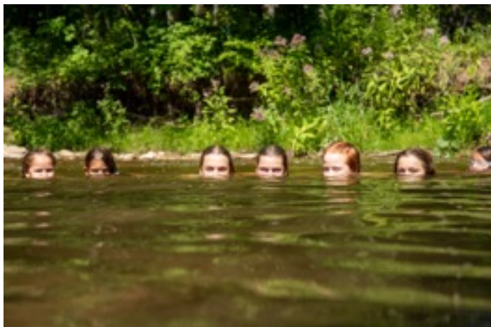
Meitenes ūdens gājienā.