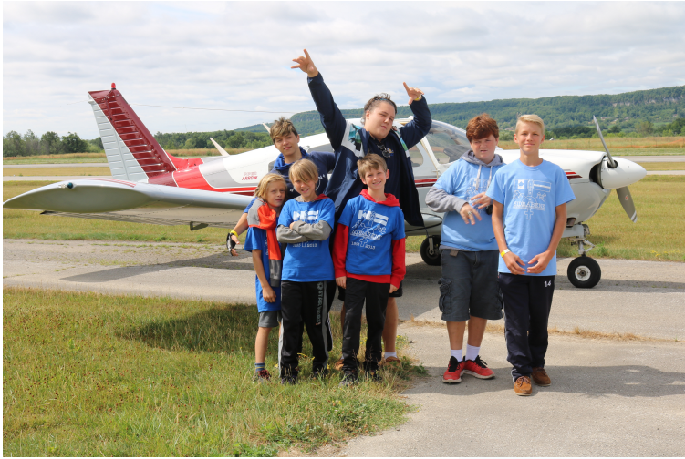
Mūs vizinās lidmašīnā! We're going to fly!