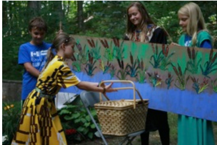
Nometnes bērni attēlo Mozas stāstu dievkalpojumā. Reenacting the Moses story in church