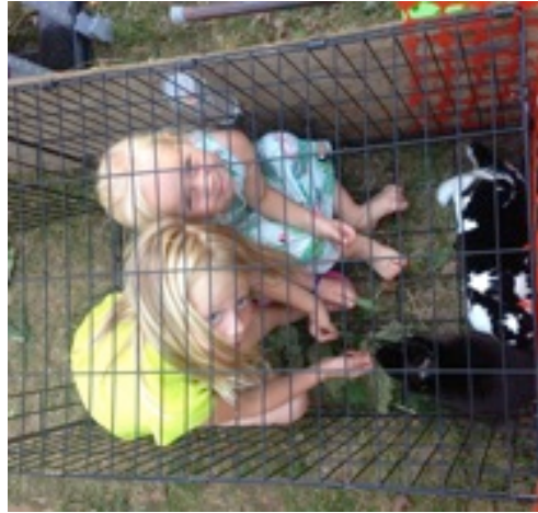
Cāliši apciemo trusīšus! Camp 'chicks' visit the bunnies!