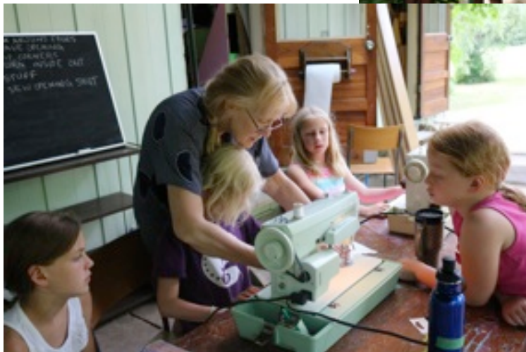
Bērni rokdarbos mācās spilvenus šūt Learning to sew cushion