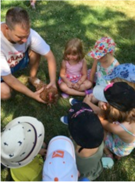
Cāliši iepazīstās ar vistiņu! Camp 'chicks' meet a real hen!