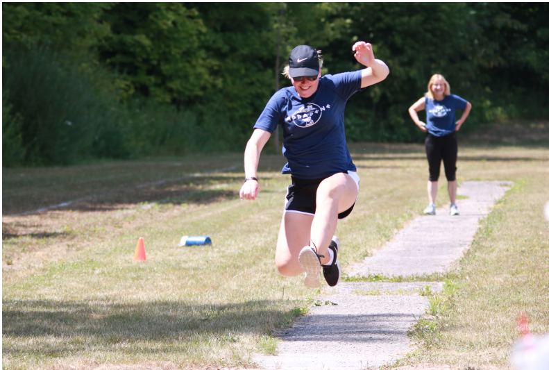
Tāllekšana Sid svētkos The long jump at Sid Fest