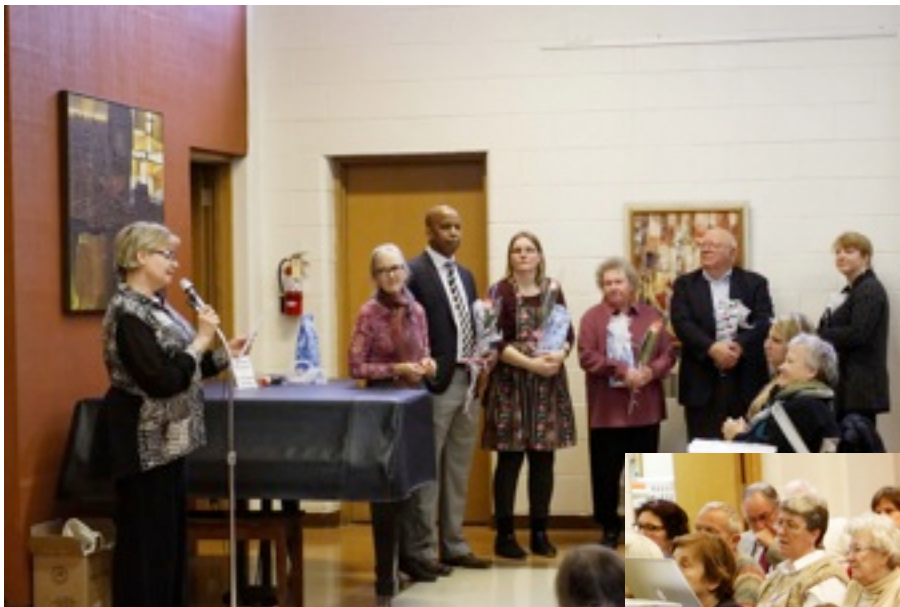
Draudzes locekļu godināšana