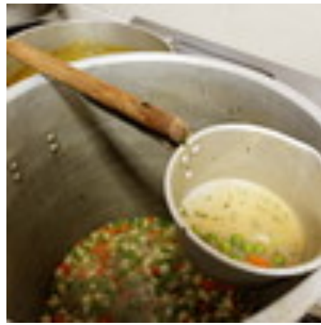
Frikadeļu zupai liela piekrišana!