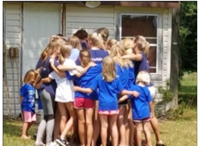
ANNUAL ‘GROUP HUG’ - GOOD-BYE UNTIL 2019!

(to see more pictures and receive updates, please see the SID Nometne Facebook page: www.facebook.com/SidNometne )