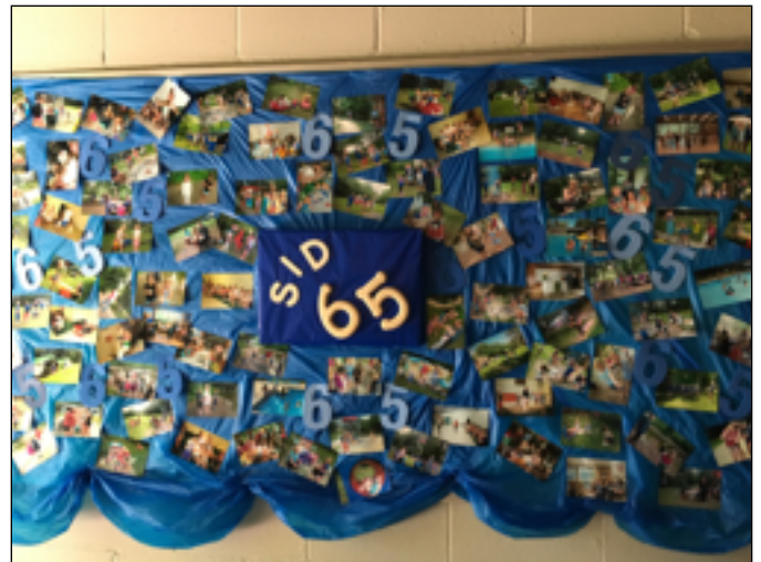
Linda Lakats bija skaisti salikusi bērnu vasaras nometnes bildes uz dēļa pie ieejas durvīm!

We’re looking forward to seeing you next year! Camp 2019 starts July 14th, 2019 - let the countdown begin! “Sidrabenē mums labi klājas!”